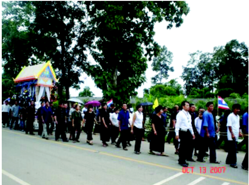
ประเพณีการดิงศพค่านิยมใหม่ที่รับจากสังคมภายนอก ความเปลี่ยนแปลงที่เกิดจากการยึดติดความหรรษาแบบสังคมเมือง

ฐานะของคนในหมู่บ้านเริ่มดีขึ้นตามลำดับ มีการปรับเปลี่ยนวิถีการดำเนินชีวิต ไปตามความเจริญทางสังคมและรับค่านิยมจากภายนอกเข้าสู่ชุมชน ความเปลี่ยนแปลงมากมายนำมาซึ่งค่านิยมใหม่ อาทิ ในอดีตไม่มีการดิงศพก็หันมาดิงทุกงาน ไม่มีปราสาทบรรจุศพก็นิยมมีแบบหลายชั้น ไม่เคยเก็บศพไว้นานก็เริ่มใช้ตู้เย็นบรรจุศพทำให้เก็บศพได้หลายวัน ในอดีตไม่มีวัดในหมู่บ้านแต่ปัจจุบันจัดให้มีพระมาสวดทุกคืน ไม่เคยมีทำอาหารเลี้ยงแขกก็เปลี่ยนเป็นตักแกงใส่ตุ๋นกลับไปทานต่อที่บ้าน ใส่ของพระไม่กี่บาทเปลี่ยนเป็นชองละหลายร้อยตามยศของพระสงฆ์ หามศพกันอย่างเงียบๆ เปลี่ยนเป็นจุดพลุประกาศให้รู้กันทั้งตำบล ไม่มีเงินทองใช้จ่ายก็เปลี่ยนเป็นชิงโชคจากโปรยทาน ไม่เคยมีสุรเลี้ยงแขกก็หันมาตั้งโต๊ะเลี้ยงกันทุกวัน ในชุมชนจัดเวทีเสวนาหยิบยก