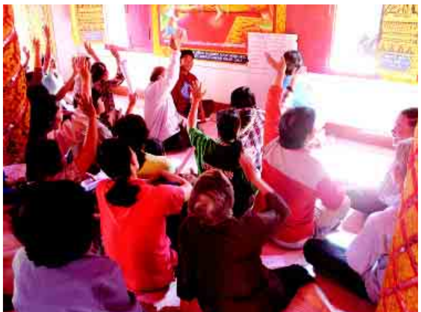
การคัดเลือกทีมวิจัยหลักเน้นตัวแทนจากกลุ่มชาวบ้าน

(ง) นำข้อมูลจากแบบสอบถาม แบบสัมภาษณ์ และข้อเสนอแนะมาวิเคราะห์แลกเปลี่ยนเรียนรู้ในเวที จนได้ร่างประเด็นข้อตกลงชุดที่สองจำนวน 18 ประเด็น แล้วคัดเลือกทีมวิจัยร่วมในหมู่บ้านจำนวน 10 คนมาร่วมพิจารณาให้ความ