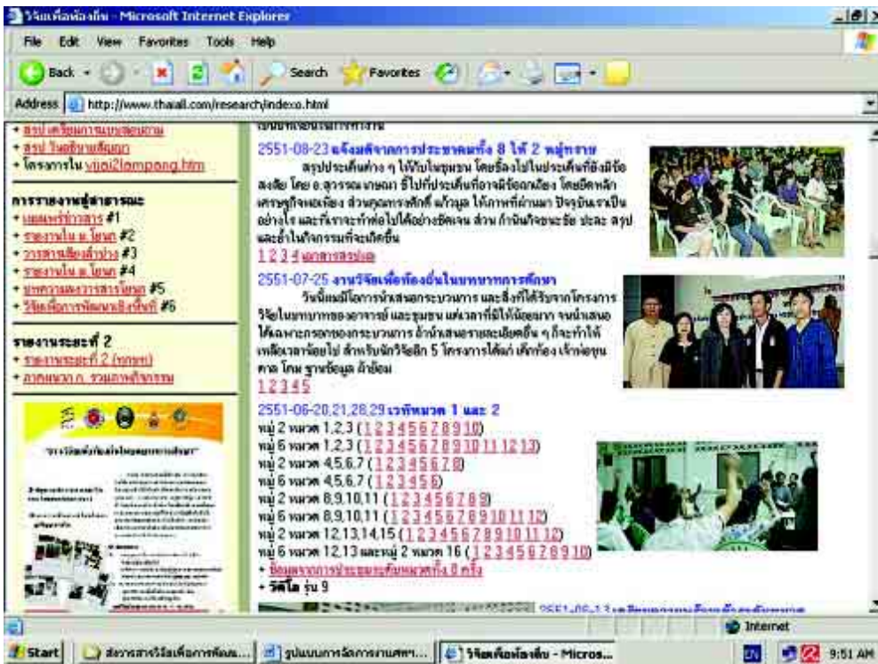
เว็บไซต์ Http : // www.thaiail.com/research อีกช่องทางในการเผยแพร่การจัดการงานศพ โดยยึดหลักเศรษฐกิจพอเพียง