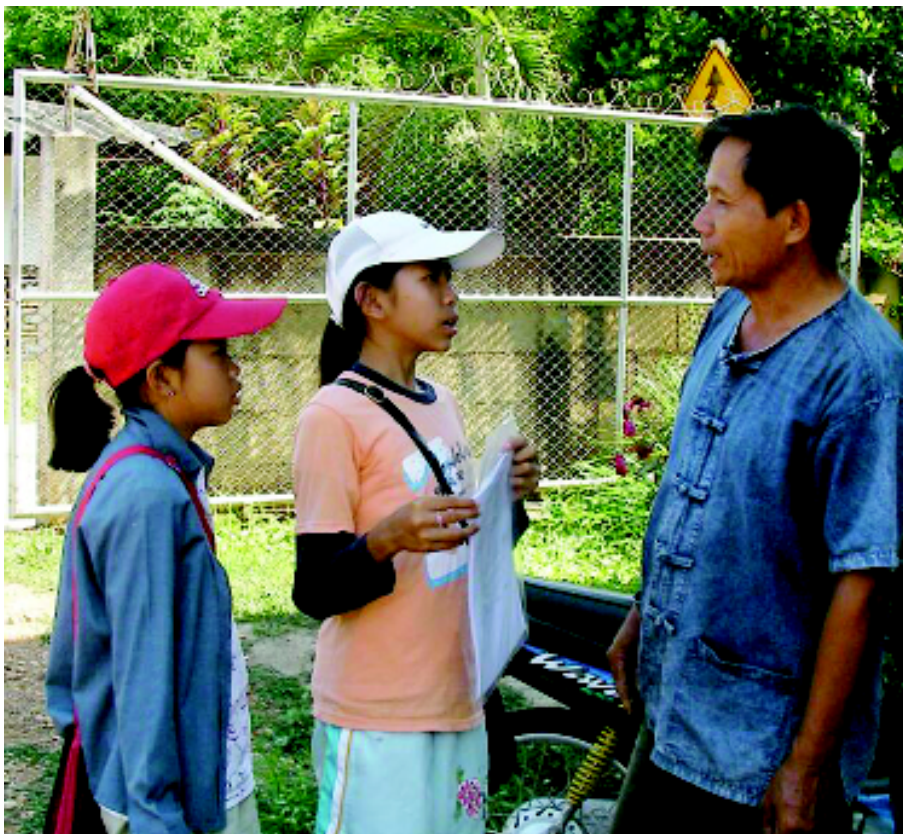
การนำผลวิจัยไปขยายผลในแต่ละหมู่บ้าน เน้นการให้เยาวชนมีส่วนร่วมเพื่อปลูกฝังค่านิยมความพอเพียงตั้งแต่เด็ก

(จ) นำผลประชามติและข้อเสนอแนะที่ผ่านการทบทวนแล้ว เข้าไปสรุปผลในแต่ละหมู่บ้านอีกครั้ง แต่ละหมู่บ้านร่วมลงนามเพื่อยืนยันข้อเสนอต่อสภาวัฒนธรรมประจำตำบลไหล่หิน และสภาฯ ได้เป็นผู้ประกาศรับรองประเด็นข้อตกลงการจัดการงานศพในระดับตำบล